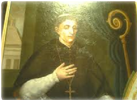
figura fundamental el nombre del insigne riojano fray Domingo de Salazar, primer arzobispo de Manila. Nació en Baños de Río Tobía por los años de 1525. Tomó el hábito de religioso dominico en el convento de San Esteban de Salamanca, en donde fue contemporáneo y condiscípulo de Domingo Báñez y de Bartolomé

En todas las obras sobre historia de Filipinas y sobre la acción evangelizadora de España en aquellos lejanos territorios aparece como