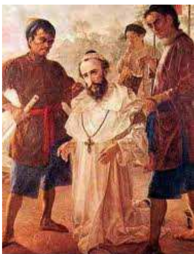
S. VALENTINO DE BERRIO OCHOA, 1827-1861 1. noviembre. (Haiti) e. (Vizcaya)

los barquichuelos pescantes, sin distinción de cristianos y de gentiles; y cuando el gran mandarín sube y baja por los ríos, allí ve la imagen de Aquél, en cuyo nombre toda rodilla se dobla en el cielo, en la tierra, en el abismo (Flp 2, 10), convertida en el objeto más vil y tratada con el mayor escarnio y vituperio.