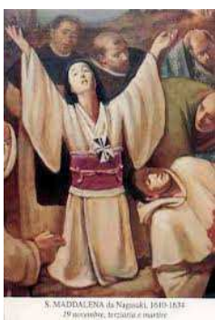
S. MADDALENA de Nagasaki, 1600-1634 29 noviembre, beata y mártir

El otro grupo fue beatificado y canonizado por el Papa Juan Pablo II. La beatificación se realizó en Manila el 18 de febrero de 1981 y la canonización en Roma el 18 de octubre de 1987. Este papa tuvo el acierto de canonizar a los mártires de las distintas naciones de Oriente. Los cristianos de aquellas remotas regiones valoran y aprecian, sirviéndoles de ejemplo, mucho más a sus mártires que a los de la Iglesia primitiva que les quedan tan lejos de su historia y de su cultura. Yo he podido experimentar esta realidad en Corea cuya fe, ya arraigada, hace referencia a sus padres en la fe, muertos por las autoridades paganas in odium fidei , en el siglo XVIII. El papa se dio cuenta de este detalle. De ese modo al canonizar al